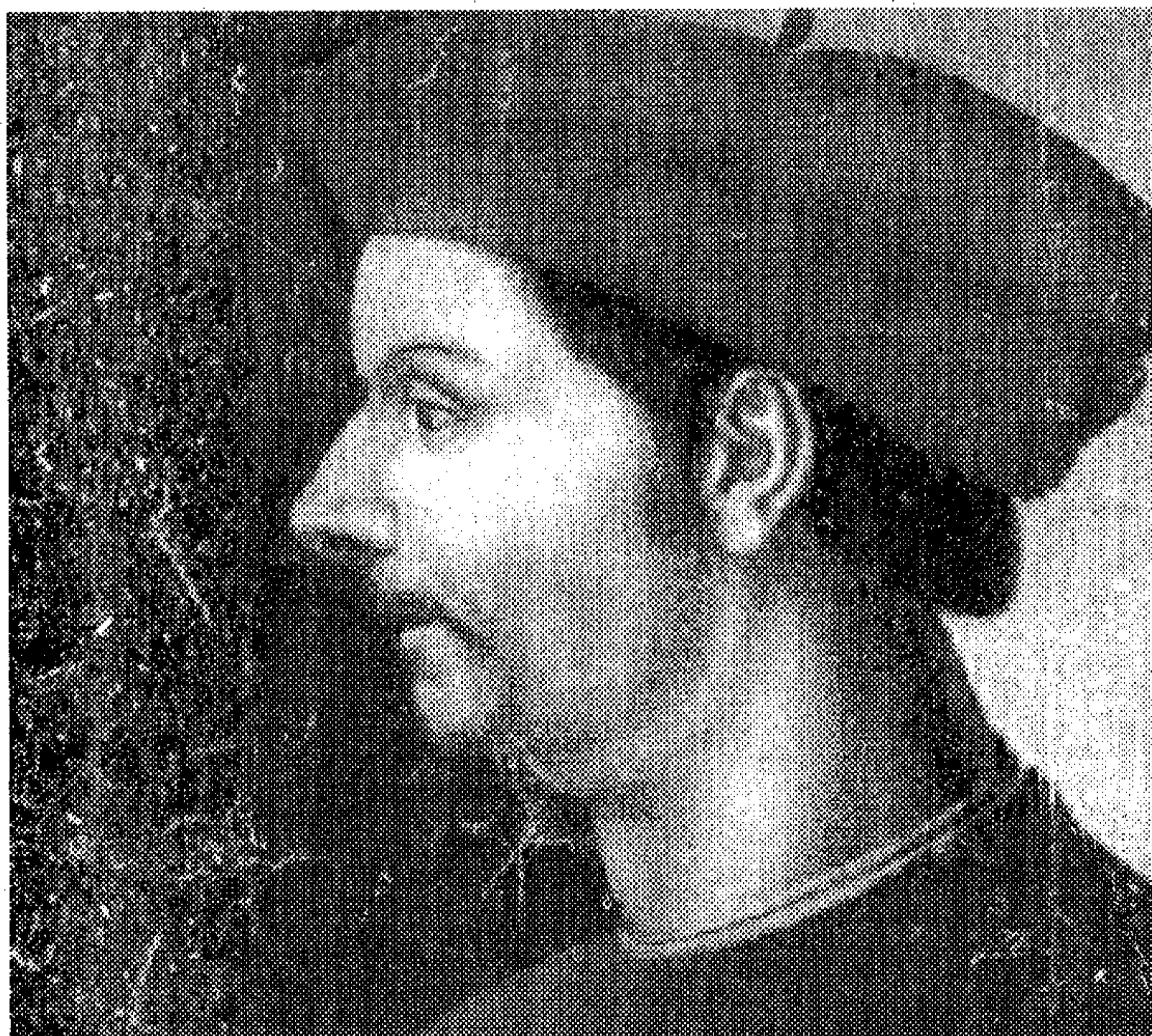
Un ritratto di Niccolò Machiavelli